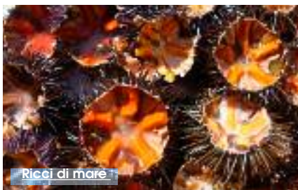
Ricci di mare

Ancora un sequestro nell'area antistante il mercato del pesce di Via Cristoforo Colombo. Ieri Polizia Municipale e Guardia Costiera hanno sottoposto a sequestro 18 Kg di pesce detenuto abusivamente, senza tracciatura e privo della necessaria documentazione sanitaria. Al venditore abusivo è stata comminata una sanzione di 309 euro. Si tratta del secondo sequestro, nel giro di pochi giorni, eseguito grazie dalla Squadra Annonaria della Polizia Municipale di Trapani, per garantire la tutela dei consumatori e il rispetto delle regole della libera concorrenza. Il giorno precedente 70 esemplari di riccio di mare erano stati sequestrati dalla Guardia Costiera di Trapani ad un venditore abusivo che li offriva per l'acquisto disposti su un tavolo di plastica. Scena non nuova, soprattutto nei pressi delle Litoranea. Questa volta però, l'incauto venditore abusivo ha allestito il suo "tavolo di vendita" in via Virgilio. Una presenza "ingombrante" che è stata segnalata alla Guardia Costiera che è intervenuta per l'accertamento ed il sequestro. Per il trasgressore è prevista una sanzione di 4.000 euro per la violazione della normativa sulla commercio di prodotti ittici.