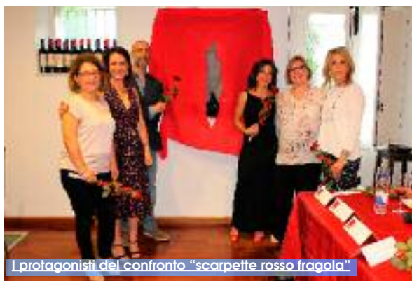
I protagonisti del confronto "scarpette rosso fragola"