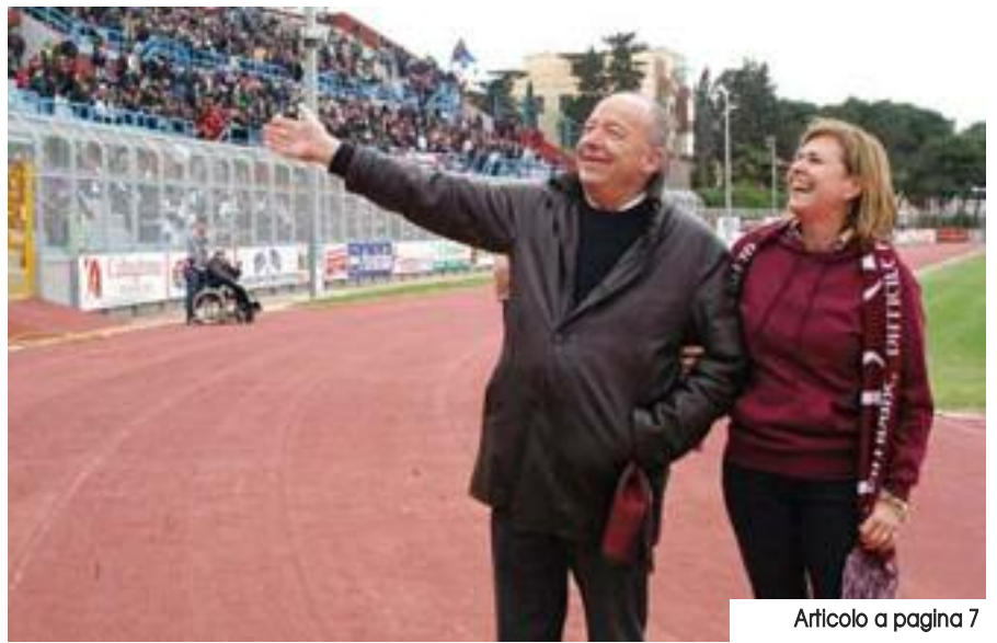
Articolo a pagina 7